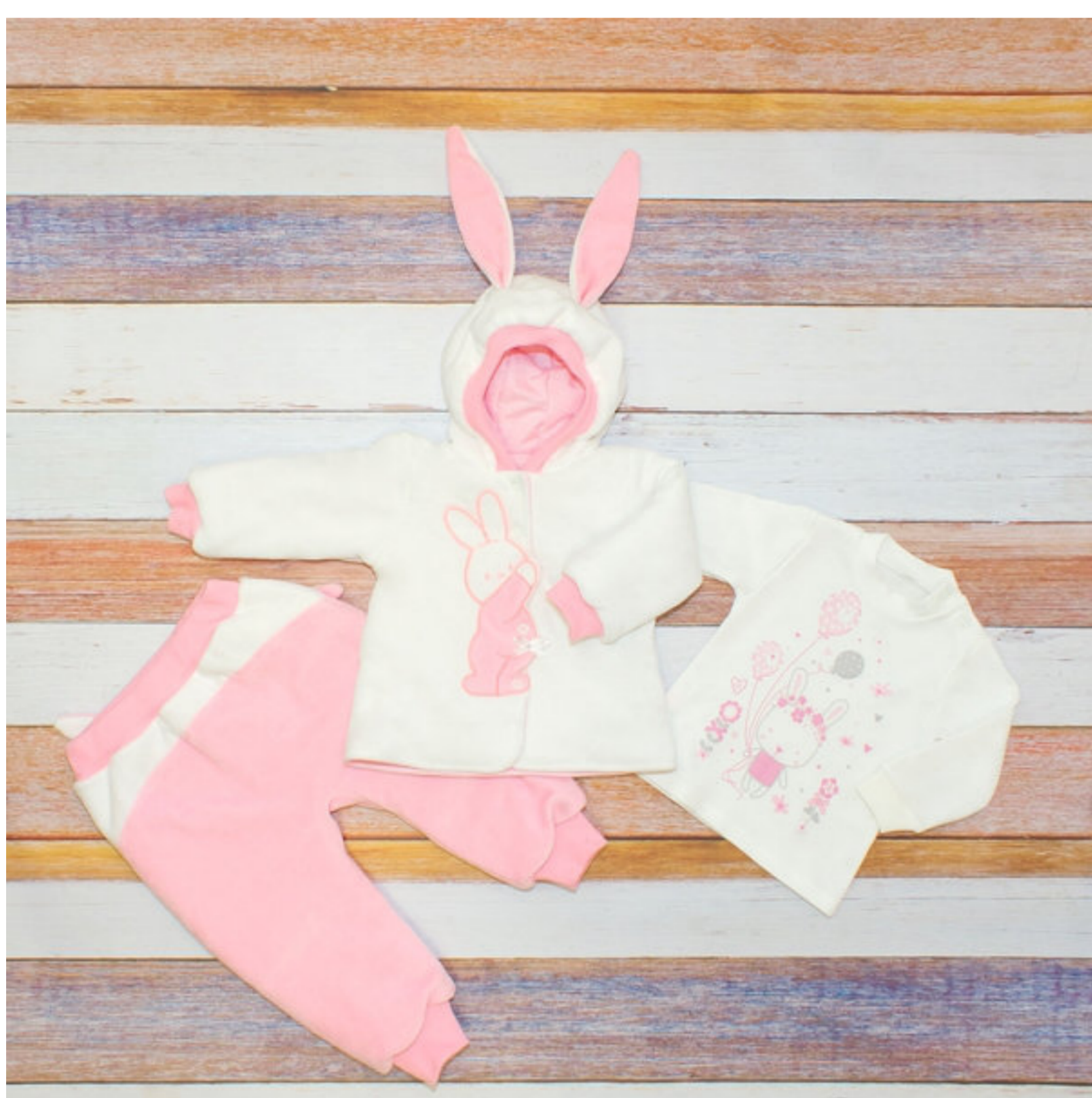
Комплект (куртка, брюки и джемпер) (Арт. 05545 втэ)

Комплект состоит из куртки, брючек и джемпера. Куртка из велюра на кулирной подкладке и на синтепоне 100 гр, силуэт трапеция. Рукав втачной длинный, низ рукав на притачной манжете. Горловина оформлена капюшоном. В швы стачивания капюшона втачаны ушки. Застежка спереди на кнопки. Полочка украшена вышивкой - "зайка". навывшивке бант и страз. Брючки из велюра на кулирной подкладке и на синтепоне 100гр. В шов притачивания кокетки на задней половинке втачаны ушки, задняя половинка - вышивка. Низ брючек на манжетах. Джемпер из интерлока. Рукав втачной длинный, низ рукава на притачной манжете. В левом плече застежка на кнопки. Перед украшен печатью.