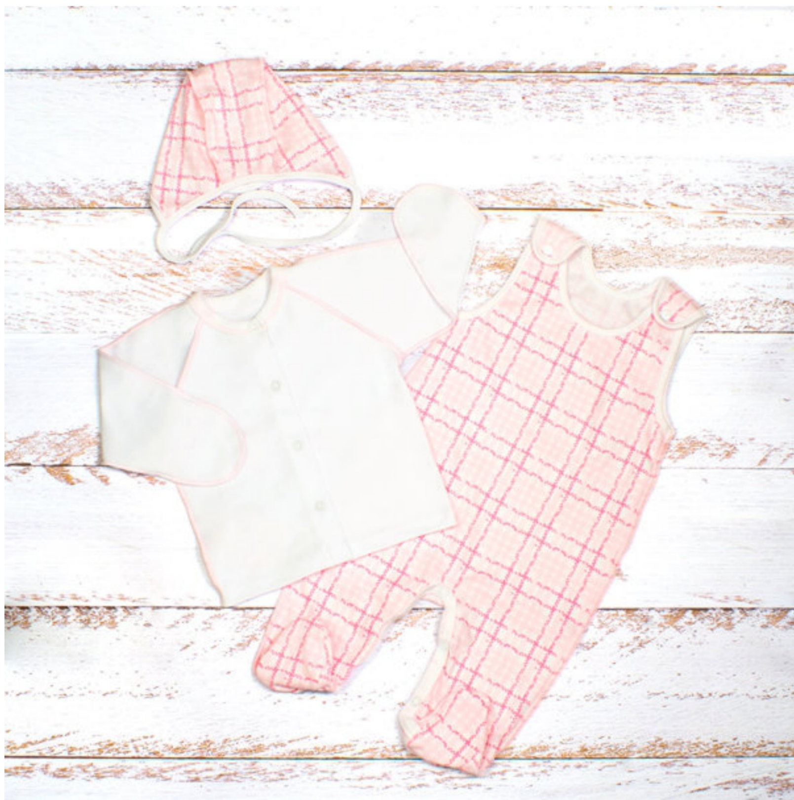
Комплект (Арт. 05992 ик)

Комплект кофточка, п/комбез и чепчик, 100% х/б