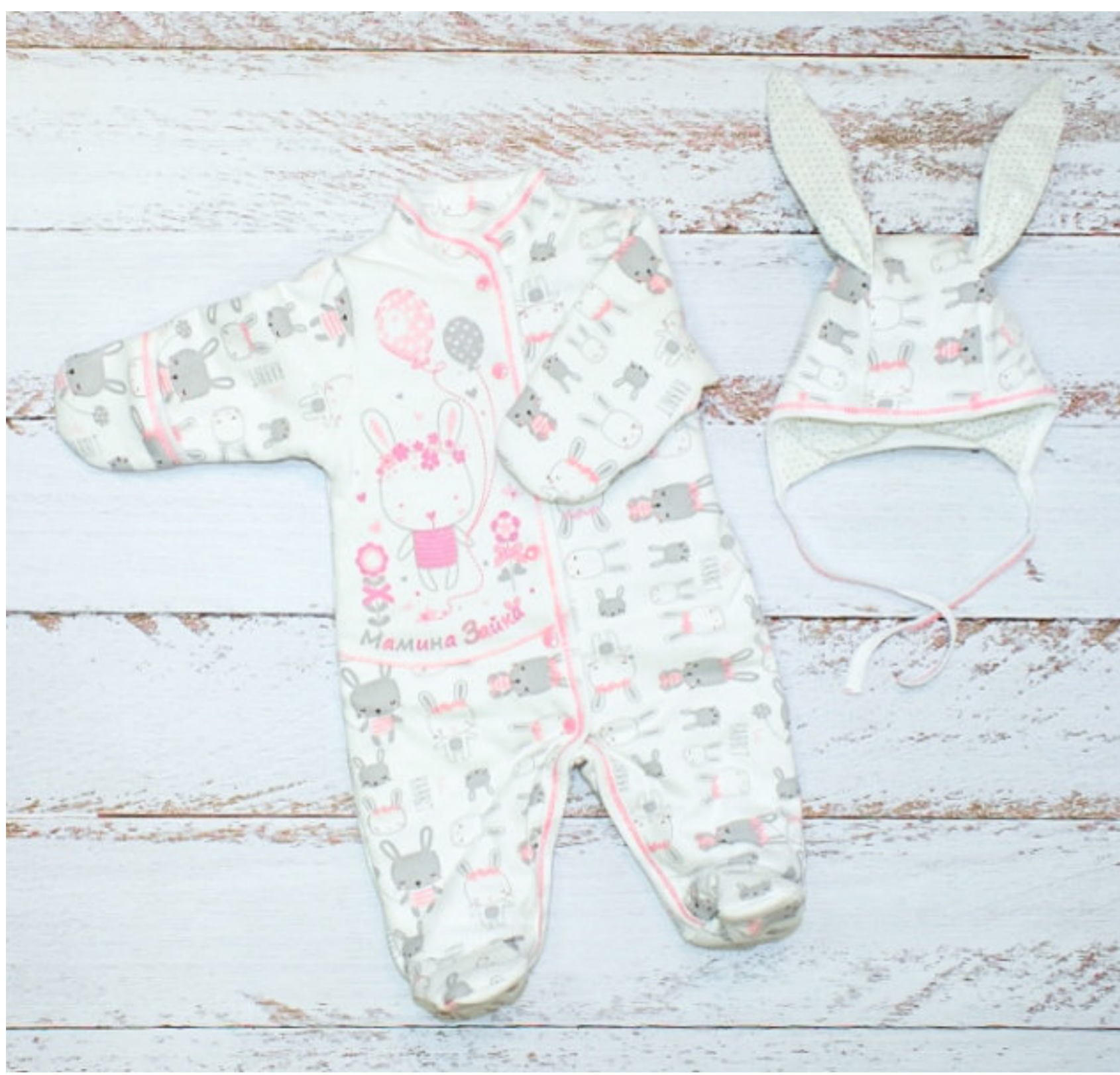
Комплект (комбинезон и шапочка) (Арт. 05543 икд)

Комплект состоит из комбинезона и шапочки. Комбинезон из набивного интерлока на кулирной подкладке 100% хлопок и на синтепоне 100 грамм. Комбинезон свободного силуэта. Рукав втачной, длинный заканчивающийся цельнокроеной рукавичкой. Горловина обработана воротником-стойкой. Застежка центральная на кнопки переходит в застежку в шаговом шве. Полочка украшена печатью. Шапочка из интерлока на кулирной подкладке 100 хлопок и на синтепоне 60 грамм. В швы соединения втачаны ушки с синтепоном 60гр.