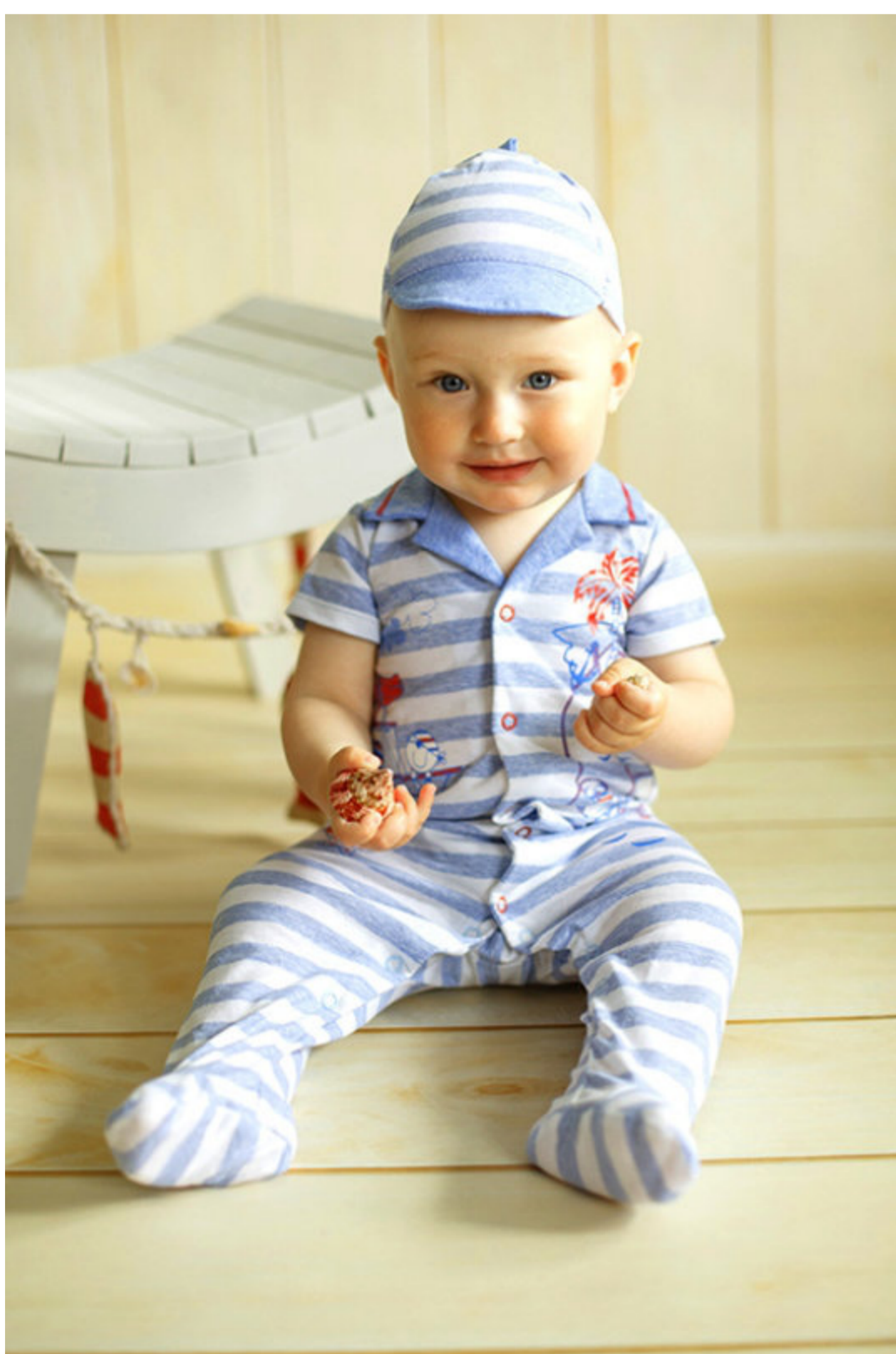
Комплект (комбинезон и кепка) (Арт. 05382 кпд)

Очаровательный комплект из легкого кулирного полотна включает в себя комбинезон и кепку. Комбинезон с застежкой на кнопки, полочки украшены печатью.