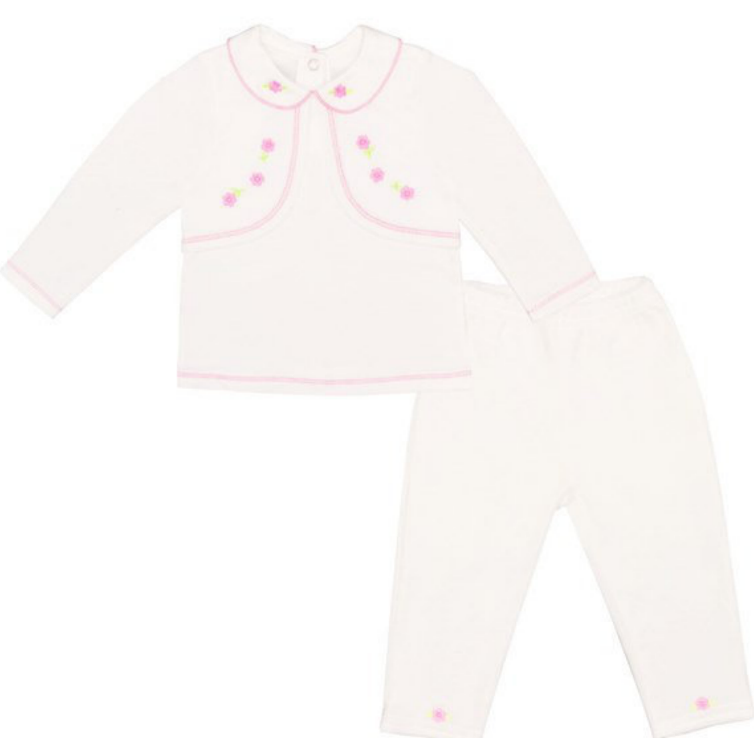
Комплект (кофта и брючки) (Арт. 05954 втд)

Очаровательный комплект включает в себя кофточку из интерлока и брючки из велюра. Комплект украшен вышивками - цветочками.