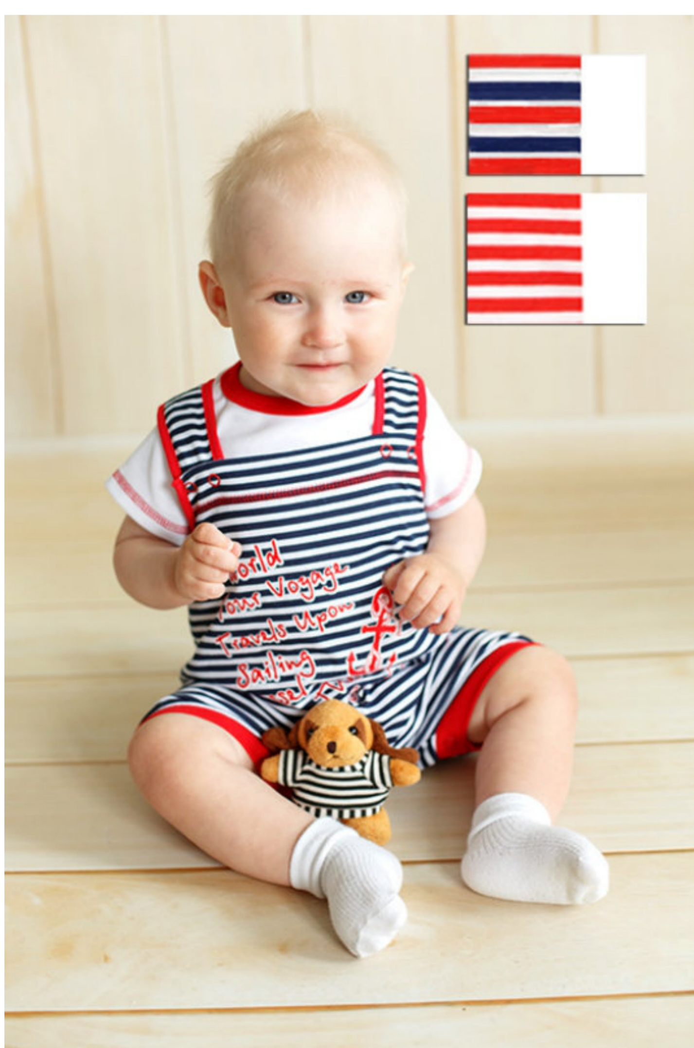
Комплект (песочник и футболка) (Арт. 05172 кпд)

Яркий летний комплект из кулирного полотна включает в себя песочник и футболку. Песочник с застежкой по бретелям и в ножках на кнопки, полочка украшена печатью. Футболка с застежкой в плече на кнопочки.