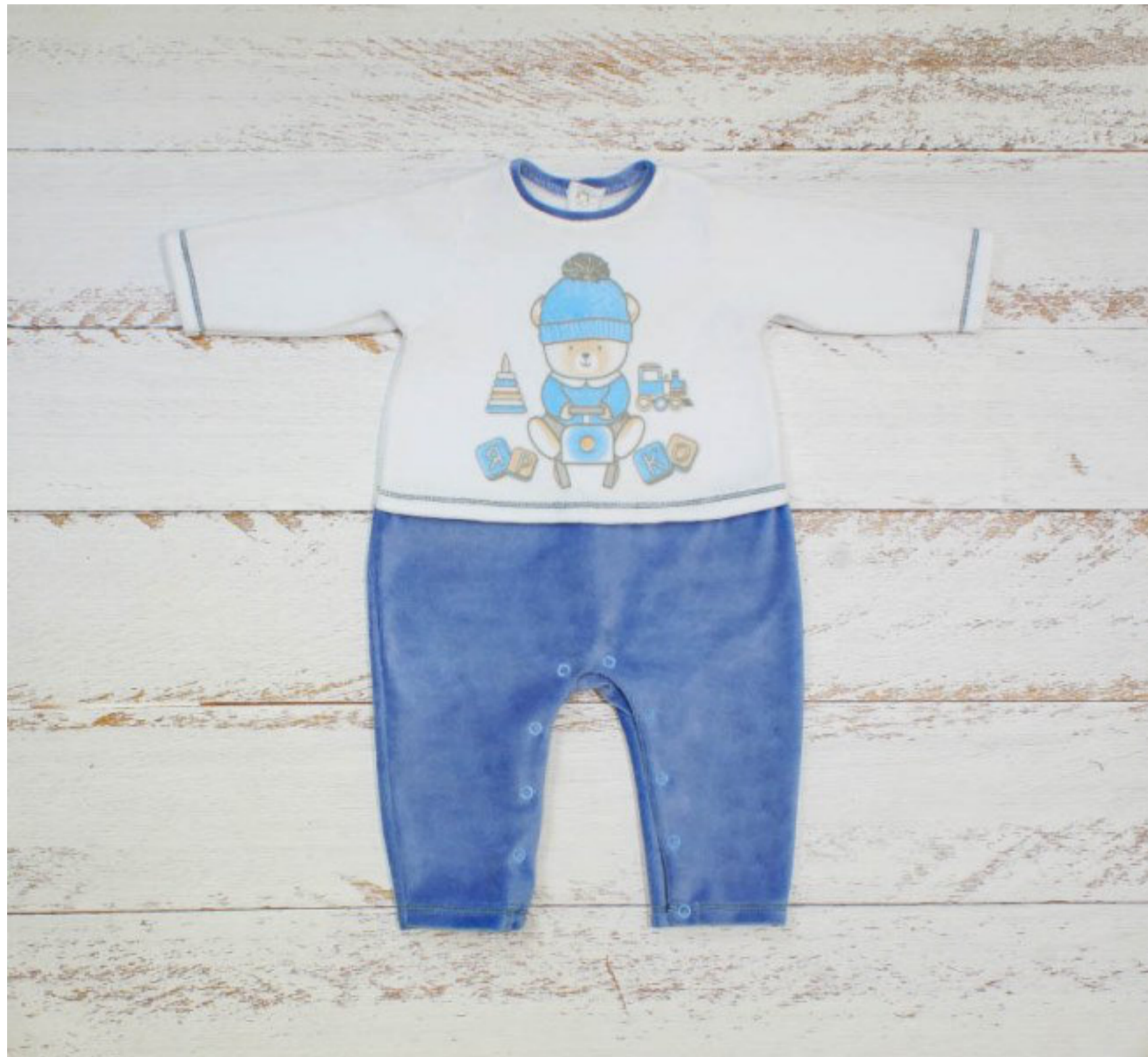
Комбинезон (Арт. 04794 втэ)

Комбинезон для мальчика из велюра, свободного силуэта. Спинка и полочки разрезные, состоят из верхней и нижней частей. Рукав длинный. Застежка сзади на спинке и в шаговом шве на кнопки. Верхняя часть полочки украшена печатью и стразиком.