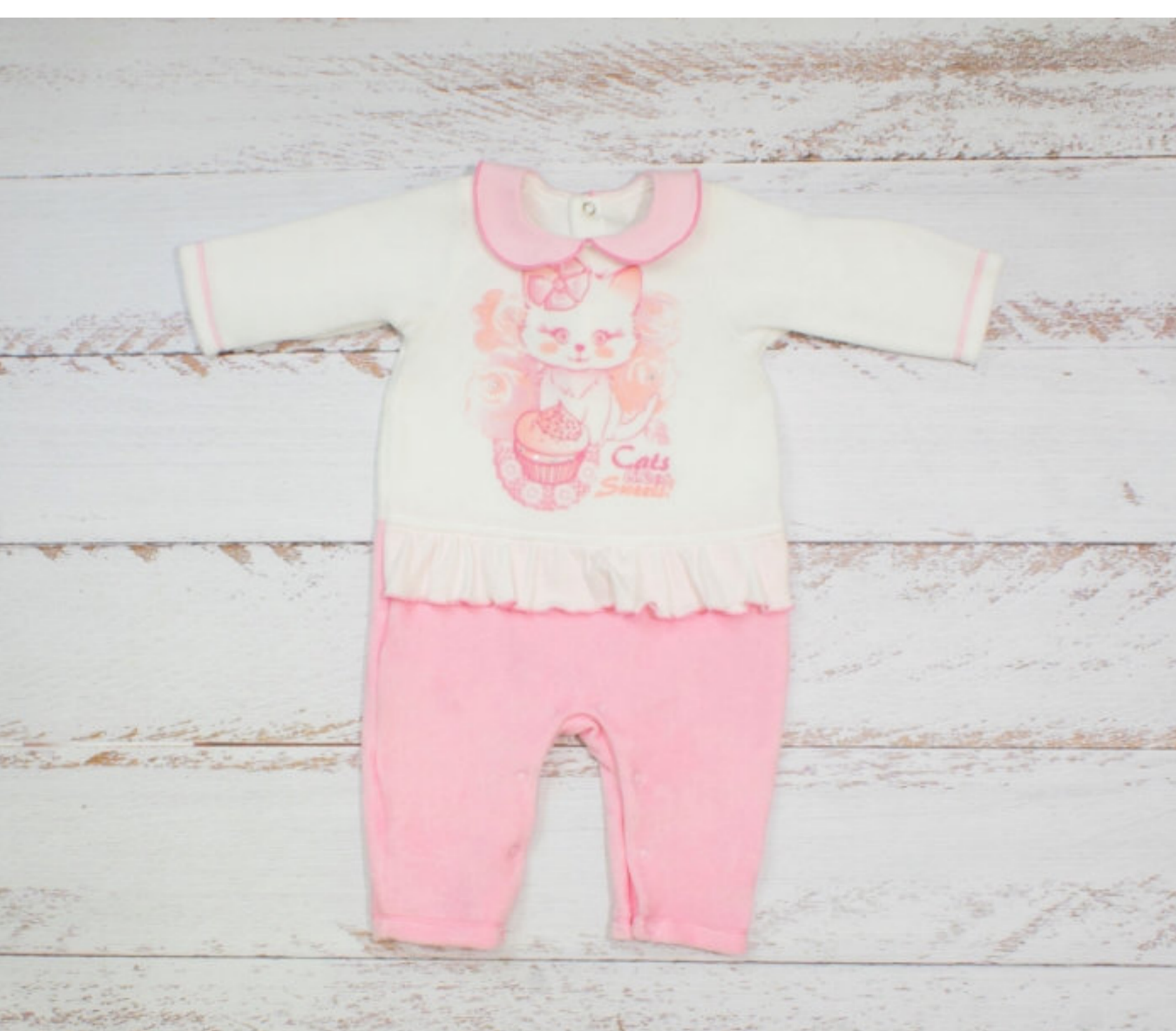
Комбинезон (Арт. 04793 втэ)

Комбинезон для девочки из велюр, свободного силуэта. Спинка и полочка разрезные, состоят из верхней и нижней частей. В шов соединения деталей полочки и спинки вшита оборка. Рукав длинный. Застежка сзади на спинке на кнопки и в шаговом шве на кнопки. Верхняя часть полочки украшена печатью и стразами.