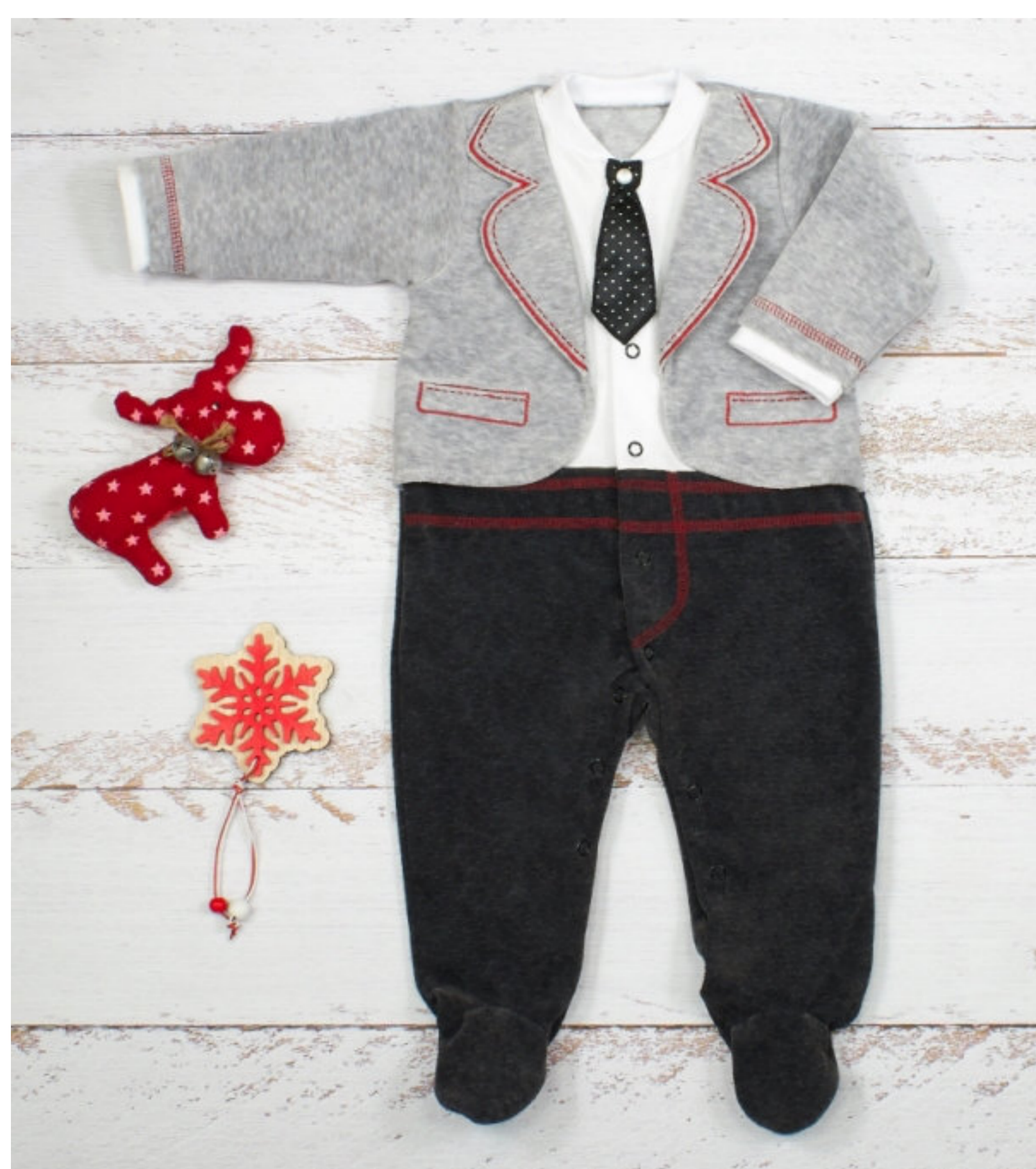
Комбинезон (Арт. 04687 втэ)

Комбинезон из велюра, застежка на кнопки. Имитирующий костюм с галстуком