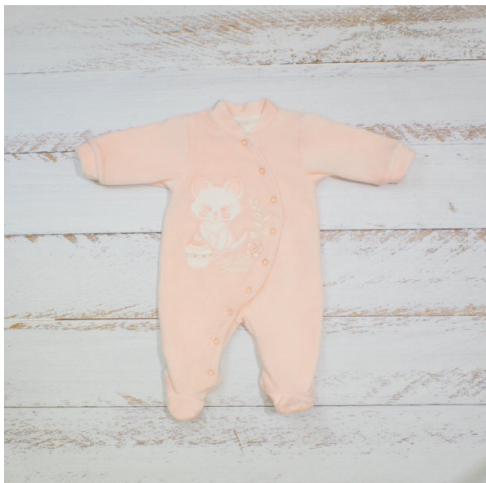
Комбинезон (Арт. 04792 втэ )

Комбинезон из велюра на кулирной подкладке 100% хлопок . Спинка цельнокроенная. Рукав втачной длинный, низ рукава заканчивается притачной манжетой из основного полотна. Застежка спереди на кнопки, уходит в одну ножку. Большая полочка украшена вышивкой. На вышивке приклеены стразы.