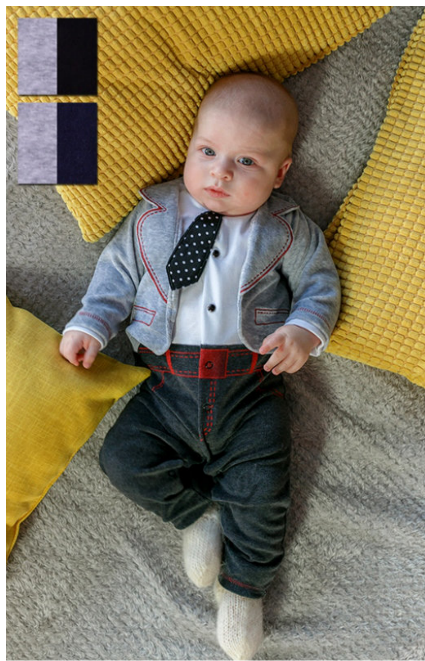
Комбинезон (Арт. 04688 втд)

Симпатичный комбинезон из велюра в сочетании с интерлоком. Застежка на кнопочки, полочки украшены печатью имитирующей пояс и карманы и вышивкой - лацканы, имитация листочек и галстук из атласа.