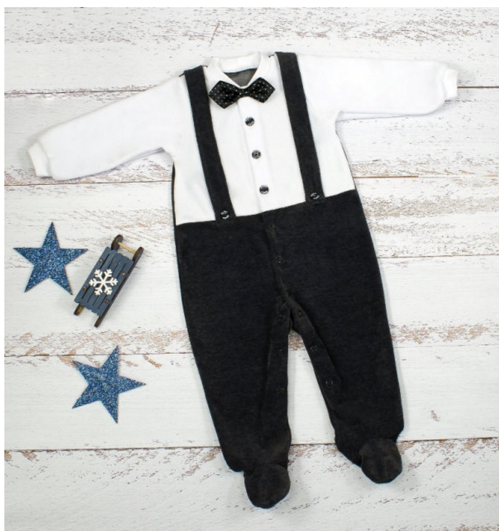
Комбинезон (Арт. 04689 вт)

Замечательный комбинезончик из велюра! Комбинезон с бретелями по переду. Застежка на пуговицы и кнопки, украшен бантом из атласа.