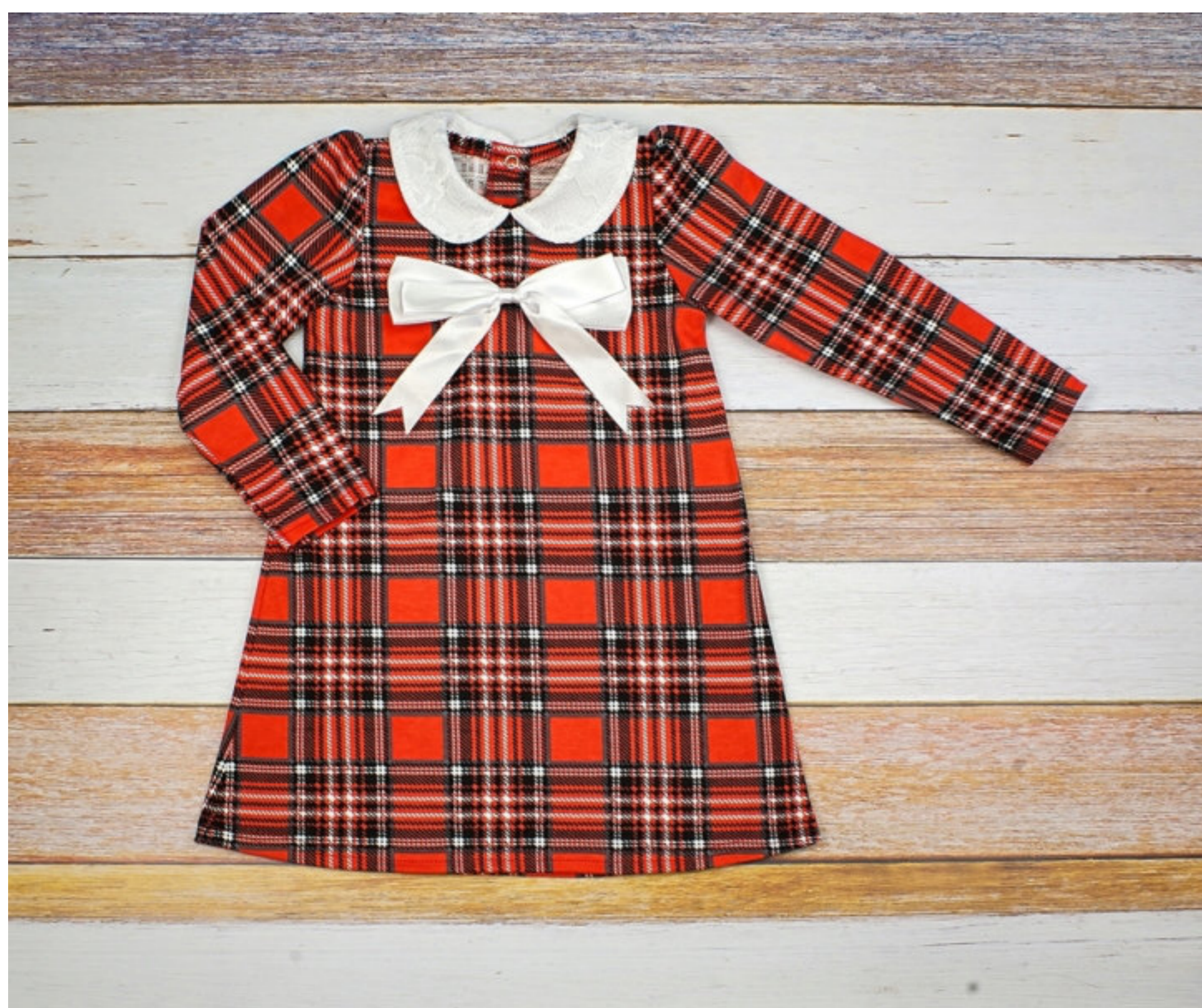
Платье (Арт. 06319 икс)

Платье из набивного интерлока расклешенного силуэта с втачными рукавами. Застежка сзади на кнопки - кольцо. Воротник из гипюра. Спереди на платье большой бант из атласной ленты съемный на булавке.