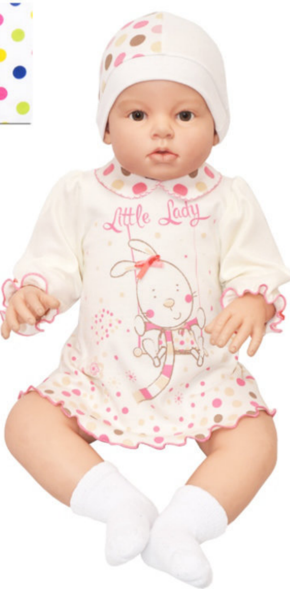
Платье (Арт. 06208 ипд)

Замечательное платье из интерлока, застежка-поло на спинке. Полочка и спинка украшены оригинальной печатью и бантиками.