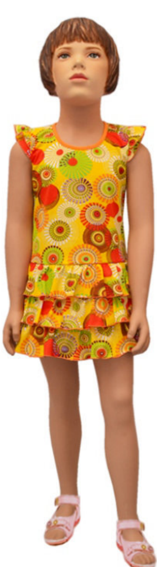
Платье (Арт. 06258 кк)

Отличное платье из набивного кулирного полотна! Застежка на спинке на пуговицу.