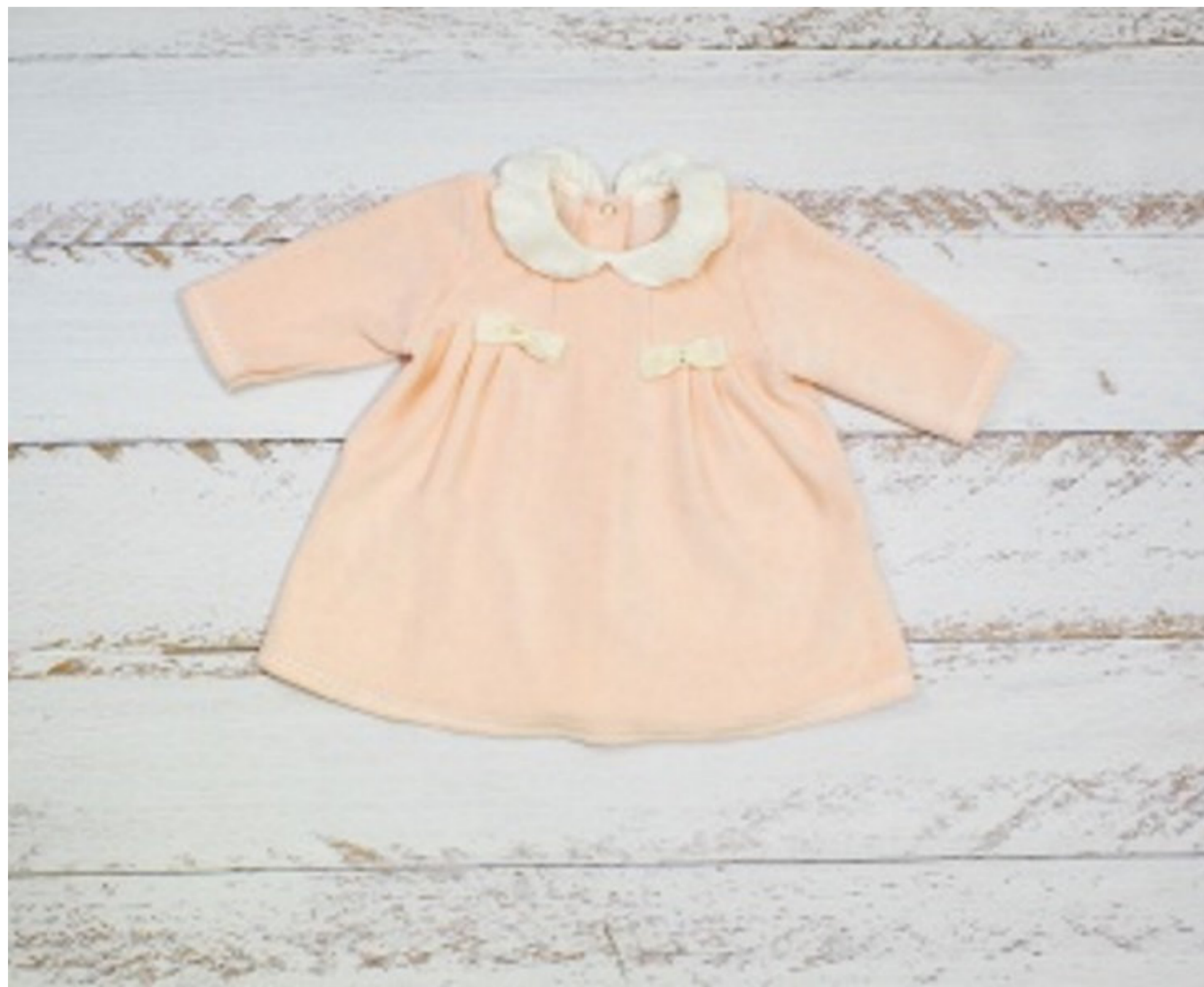
Платье (Арт. 06328 втс)

Платье для девочки, из велюра, слегка расклешенного силуэта. Полочка с отрезными боковыми кокетками. По нижнему шву втачивания кокеток-вставок со стороны полочек заложены складки. По кокетке идут два бантика из бархатной ленты со стразами на перемычке. Рукав втачной длинный. Горловина оформлена воротничками. Застежка сзади на спинке на кнопки.