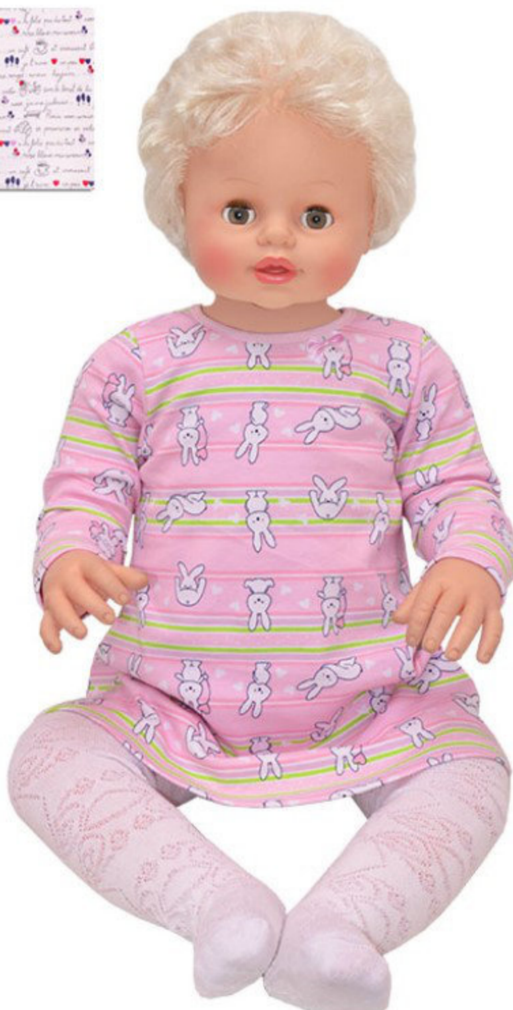
Платье (Арт. 06292 инн)

Нежное платье из интерлока. Застежка на спине на кнопки. Платье украшено бантиком.