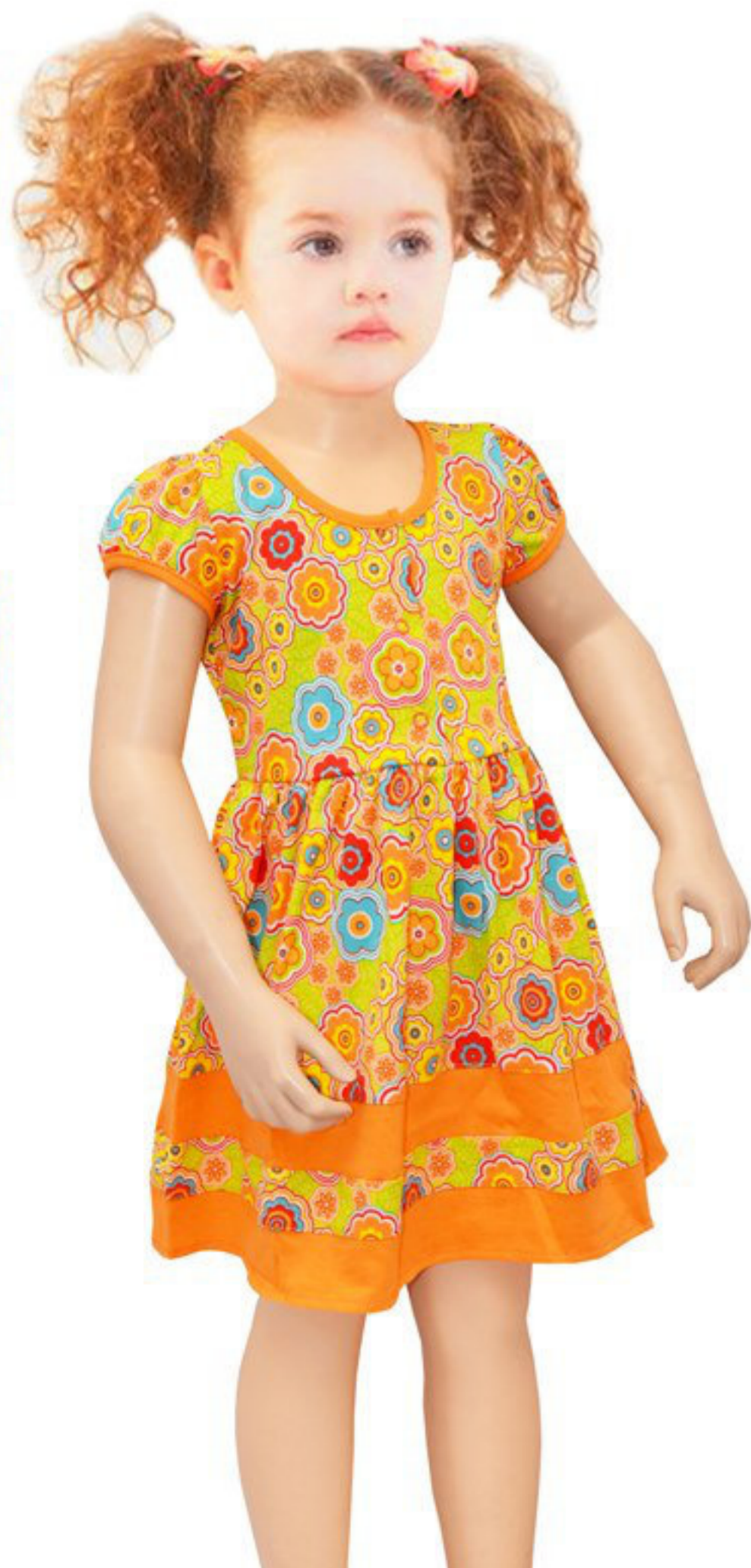
Платье (Арт. 06257 кк)

Платье из разноцветного кулирного полотна для Вашей красавицы! Застежка на кнопки спереди.